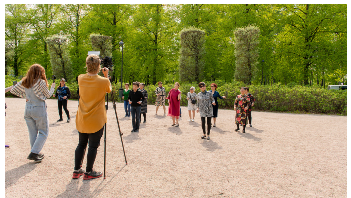
Jade-yhteisön kuvauspäivä. Kuvat: Ee Eisen ja Ami Koiranen