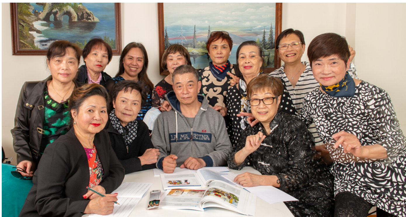
Jade-yhteisön kiinankielisten ryhmä.

Järjestöjen monikielisen ja monikanavaisen koronaviestinnän koordinaatiohankkeen uutiskirje