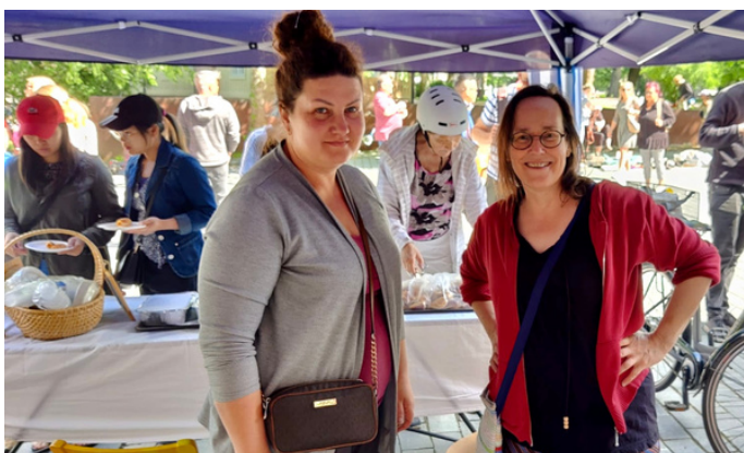
Vanhan Suurtorin Turku-kirppiksellä. Kuvat: Varsinais-Suomen Viro-keskus